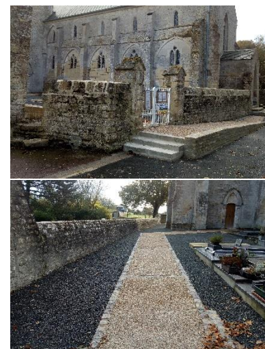
Accessibilité de l'église

Pour le centenaire de l'armistice 1918, une cérémonie d'hommage aux morts pour la France a été organisée dans notre cimetière en présence des jeunes de Vierville et d'un représentant de l'association du souvenir français. A cette occasion deux sépultures laissées à l'abandon ont été refaites et la commune s'est engagée, par prise de délibération, à les entretenir éternellement.