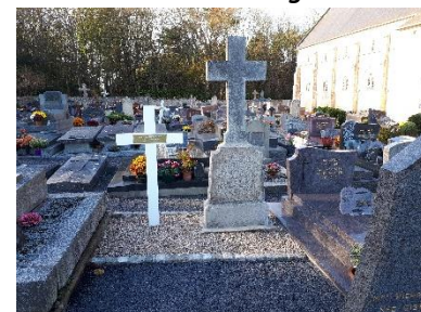
Deux morts pour la France